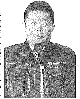
肝に銘じて、これとし一年間を過ごしていききたい」と呼びかけた。続いて、企業表彰と職長表彰

【帯広発】宮坂建設工業は十一日、帯広市内の北海道ホテルで二十三年度防災推進会議を開催した。同社社員や協力会社から四百二十人が出席。労働安全や交通安全、地域防災に関する講話の聴取などを行い、これとし一年間の無事故・無災害を誓い合った。