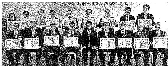
表彰状を手にする各社の代表者ら