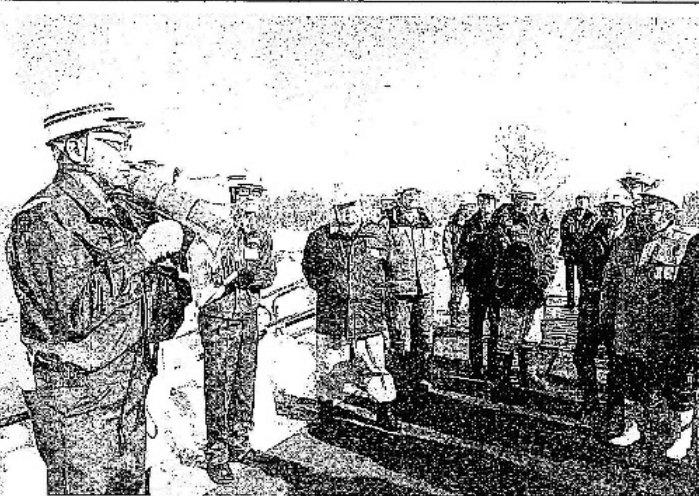
災害の再発を防ぐ取り組みを説明した

【帯広】帯広開建は1日、札内川左岸大正橋下流地先災害復旧の現場を公開した。工事は、昨年8月の台風による札内川の増水で堤防が決壊した箇所の本復旧に取り組みのもの。参加した地元自治体の関係者約30人は、