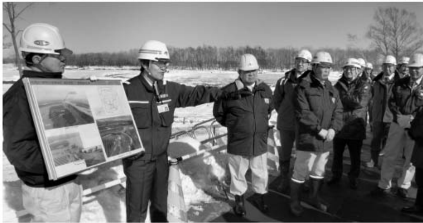
堤防の復旧工事が始まった帯広市中島町の札内川を見学する関係者（1日午前11時20分ごろ）

国の今年度第3次補正予算が1月31日に成立し、十勝管内分では昨年8月の台風被害の復旧費などが盛り込まれた。基大な被害を受けて通行止め中の国道274号日勝峠は227億円、同38号狩勝峠には56億円が復旧工事に計上された。1日には帯広市などで、堤防が決壊した河川の復旧工事も本格的に始まった。